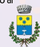
COMUNE DI COLCERESA